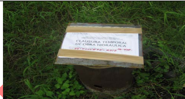
Fotografía 1: Estado del pozo 1 al momento de la verificación realizada por los inspectores.